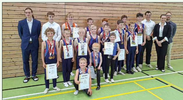
Kreis-Kinder- und Jugendspiele Jungen, Foto: Annett Körner