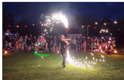
Feuershow TNT Fire Crew