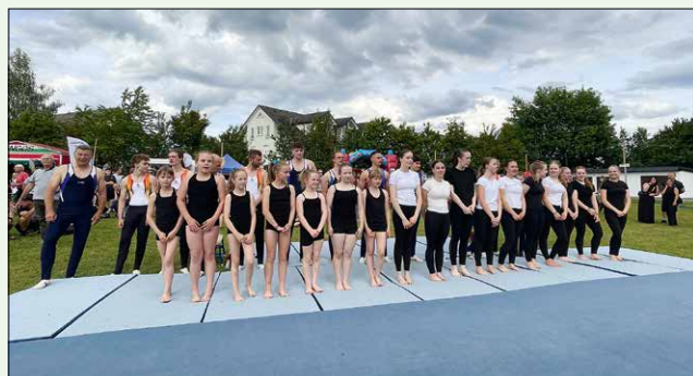
Auftritt beim Dorffest Ottendorf