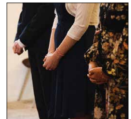
Betende Hände (von Niederlichtenauer Konfirmanden)

Wirkliche Veränderungen zum Guten gesehen, wo ein Einzelner an seinem Platz regelmäßig betet, sich zu seinem Glauben bekennt und für die Treue zu Gott alles aufs Spiel setzt. Sie können so ein Mensch sein.