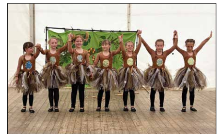
Schülerfreizeitzentrum Mittweida