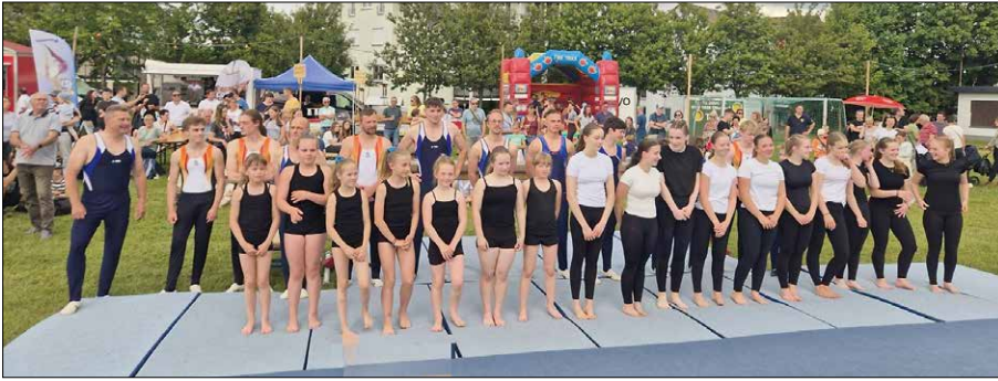
ATV Garnsdorf, Foto: H. Reichel

Viel Sonnenschein, angenehme Temperaturen und viele Besucher: Das 31. Dorf- und Kinderfest in Ottendorf hat am Wochenende eindrucksvoll gezeigt, wie lebendig das Dorfleben in der Region ist. Tausende Gäste nutzten die Gelegenheit, gemeinsam zu feiern, alte Bekannte zu treffen und ein abwechslungsreiches Programm für die ganze Familie zu genießen. Für die Organisatoren war schnell klar: Das Festwochenende gehört zu den erfolgreichsten der vergangenen Jahre.