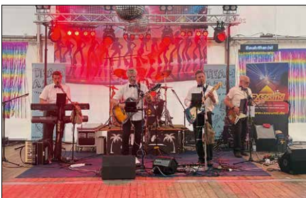
Team Azur